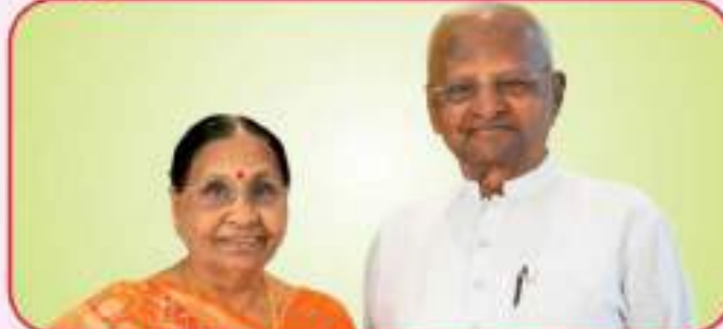
માતુશ્રી રતનબેન કેશવજી તલકશી પાસડ (દેઢીઆ - સાંતાક્રુઝ) હુલામણું નામ...મરૂદેવા માતા - નાભિ સજ્જ